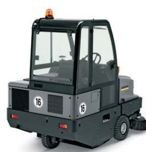
KM 150/500 R D / 4W