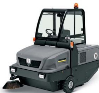
KM 150/500 R Bp